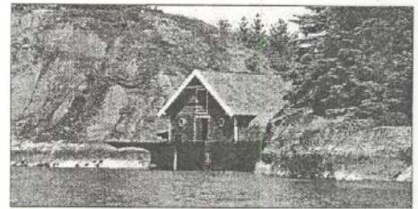
MEIR HANDLEFRIDOM: Regjeringa vil la kommunane få større råderett over si eiga kystlinje.

– Eg tenkjer på det når eg ser at det minskar i sentrum, men det styrer seg sjølv. Eg valde å satse, og du får ikkje førdefolk til å reise til Naustdal, seier Nyhammer.